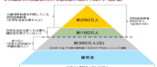
■65歳以上の高齢者における認知症の現状(平成22年・推計値)

また、日本は世界でも1番と言われるほどの認知症大国。厚生労働省の推計では65歳以上の高齢者の認知症有病率は約15%(約439万人)となっており、病院にかかっていない予備軍まで含めると高齢者の4人に1人の羅漢率と推測されています。